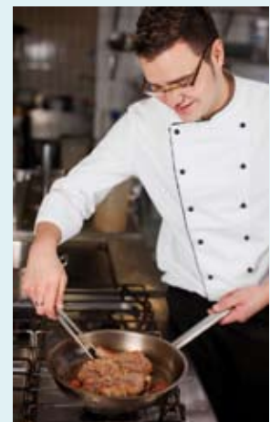
Partyservice & Events

www.BI-Catering.de | Anfrage@BI-Catering.de | Telefon 040 73 92 30 36