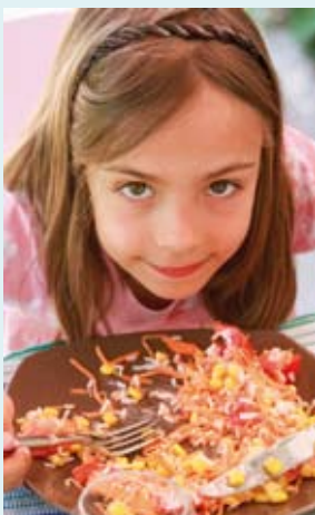
Kitas und Schulen