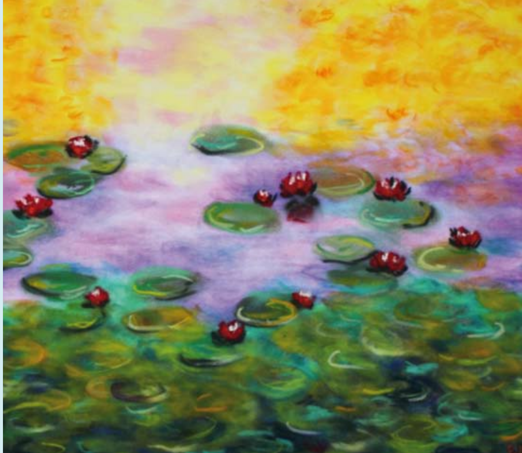
Bildquelle: Ulrich Pohl, „Seerosen“